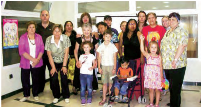
► Participantes del cursillo.