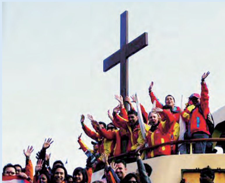
► Jóvenes españoles con la cruz de los Encuentros Mundiales de la Juventud.

El Papa recibió el pasado día 2 de julio al cardenal Antonio María Rouco Varela, arzobispo de Madrid, con los miembros de la Fundación «Madrid vivo», promotores de la próxima Jornada Mundial de la Juventud, que se celebrará en agosto de 2011 en la capital de España. «Son muchos los jóvenes -dijo el Santo Padre- que tienen puestos sus ojos en esa hermosa ciudad, con el gozo de poder encontrarse en ella, dentro de pocos meses, para escuchar juntos la Palabra de Cristo, siempre joven, y poder compartir la fe que los une y el deseo que tienen de construir un mundo mejor, inspirados en los valores del Evangelio». Benedicto XVI invitó a todos «a seguir colaborando generosamente en esta bella iniciativa, que no es una simple reunión multitudinaria, sino una ocasión privilegiada para que los jóvenes de vuestro país y del mundo entero se dejen conquistar por el amor de Cristo Jesús, el Hijo de Dios y de María, el amigo fiel, el vencedor del pecado y de la muerte. Quien confía en Él, jamás queda defraudado, sino que halla la fuerza necesaria para elegir el camino justo en la vida». El Santo Padre aseguró a los presentes y a sus familias un recuerdo «en la oración, pidiendo a Dios que bendiga los esfuerzos que estáis realizando para que la próxima Jornada Mundial de la Juventud alcance copiosos frutos».