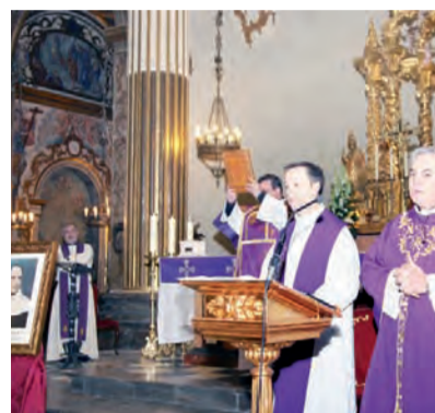
► Misa de apertura del 125 aniversario.

Esperamos y deseamos que sigamos impulsando nuestro Proyecto Educativo para que nuestro sueño se cumpla: continuar haciendo camino en Callosa educando a la luz del Evangelio