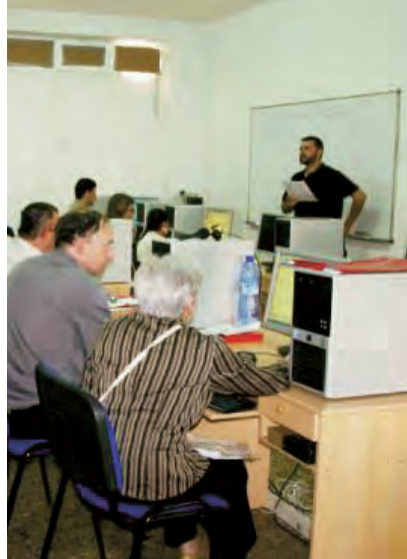
► Un momento del curso.

Desde hace varios años la Confederación de Cáritas Española ha impulsado la puesta en marcha de la herramienta SICCE (Sistema de Información Confederal de Cáritas Española) para articular coherentemente toda la información sobre la situación de las personas y las intervenciones sociales que se desarrollan en nuestras Cáritas: acogida, diagnósticos, ayudas monetarias o en especie, gestiones jurídicas, alojamientos, talleres, ofertas de empleo, ... El objetivo de esta herramienta de trabajo es responder a las necesidades de trabajo cotidiano de intervención social y de información de la organización de forma integral, integrada e integradora, utilizando de manera más eficaz los recursos con los que cuenta la Confederación acorde con las nuevas tecnologías. Cáritas Diocesana está implantando esta herramienta en nuestras Cáritas parroquiales e interparroquiales. Hasta junio de 2010 se han realizando varios cursos de formación a voluntarios y contratados para capacitarlos en el manejo de este sistema: Elche, Calpe, San Vicente del Raspeig, Alicante, Villena y Elda. Esperamos que a finales de año todas las Cáritas de la diócesis conozcan la herramienta y su aplicación en la intervención social.