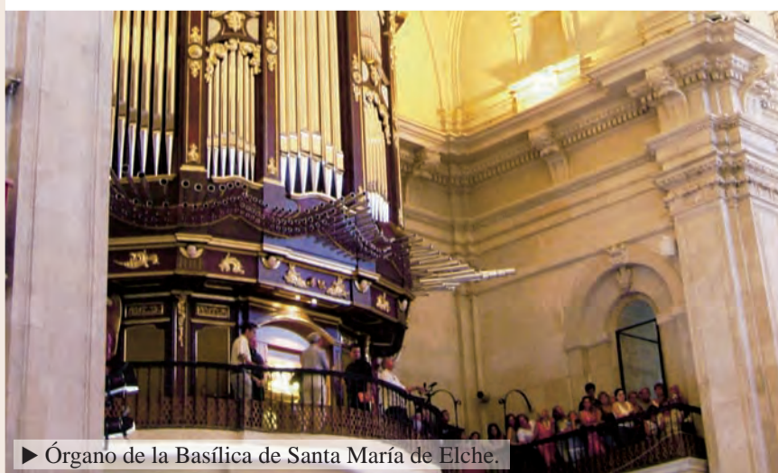
► Órgano de la Basílica de Santa María de Elche.