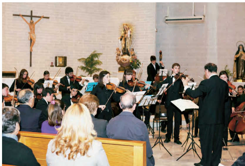
► La Eucaristía estuvo animada por el Coro de la Parroquia y tres «insignes» violinistas: dos alumnas de 3º y un alumno de 4º de la ESO.

Hemos tomado conciencia de que somos parte de una historia escrita con vidas que han ido dejando una impronta en la página que nos ha tocado llenar.