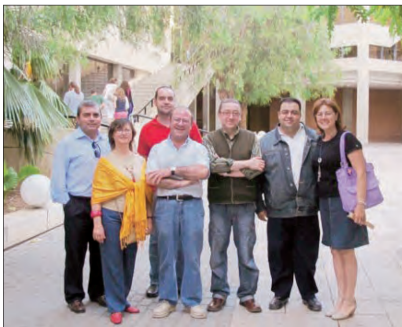
Miembros de la Comisión de Infraestructura del Congreso de Laicos frente al Paraninfo de la Universidad de Alicante, sede del Congreso.