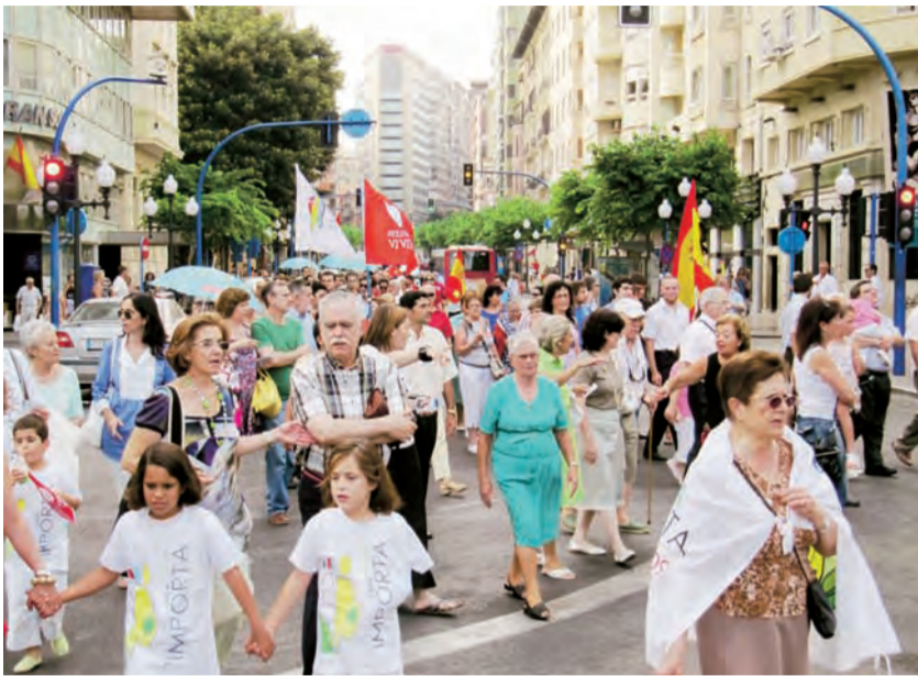
►El grupo marcha por la vida en la Rambla de Alicante.

El pasado día 3 de julio se convocó una marcha por la vida en contra del la nueva ley relativa al aborto.