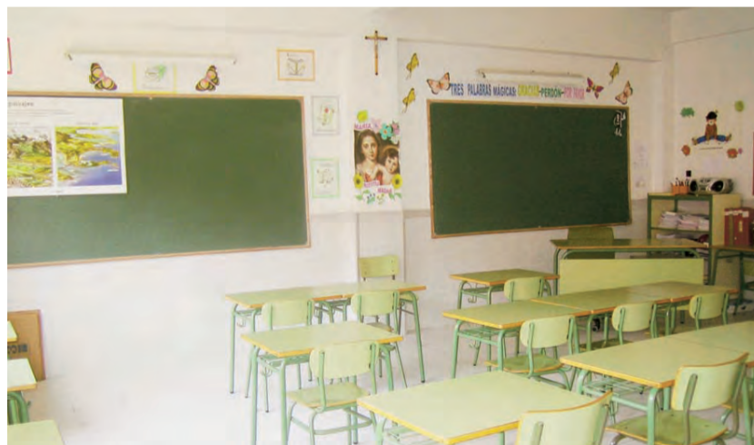
► Interior de un aula del colegio.

so de los antiguos alumnos cuando, años después de haber salido del Colegio, los encuentras por la calle o integrados plenamente en la sociedad desempeñando cualquier profesión. Cuando vienen a pedir la lista de su clase para organizar al-