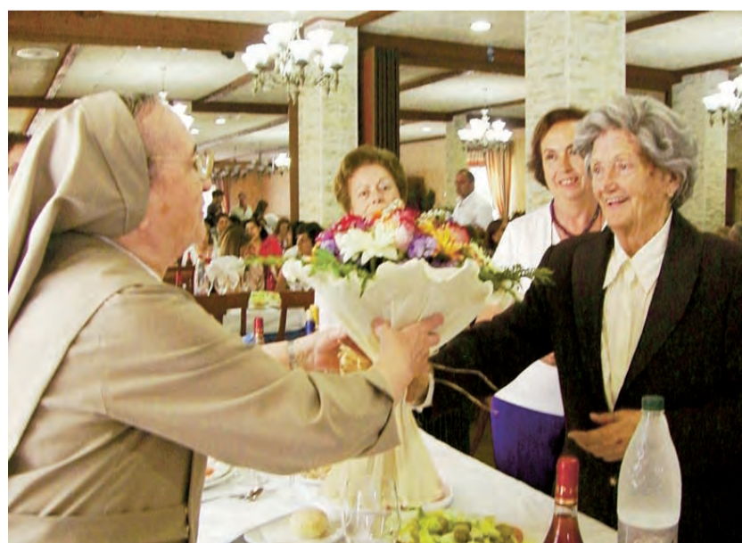
► Encuentro de antiguas alumnas.

La Comunidad de Carmelitas Misioneras Teresianas Callosa de Segura