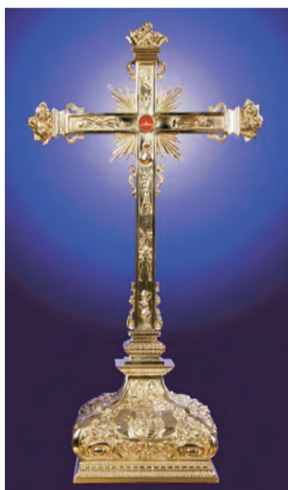
► Relicario de la Santísima Cruz de Granja de Rocamora.