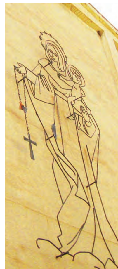
► Imagen de la Virgen del Rosario en la fachada de la iglesia y el colegio.

La constatación de que no toda la semilla que se siembra se pierde, ofrece la garantía de seguir apostando por educar en valores