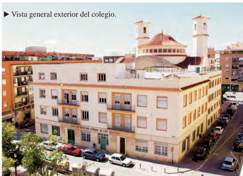
► Vista general exterior del colegio.