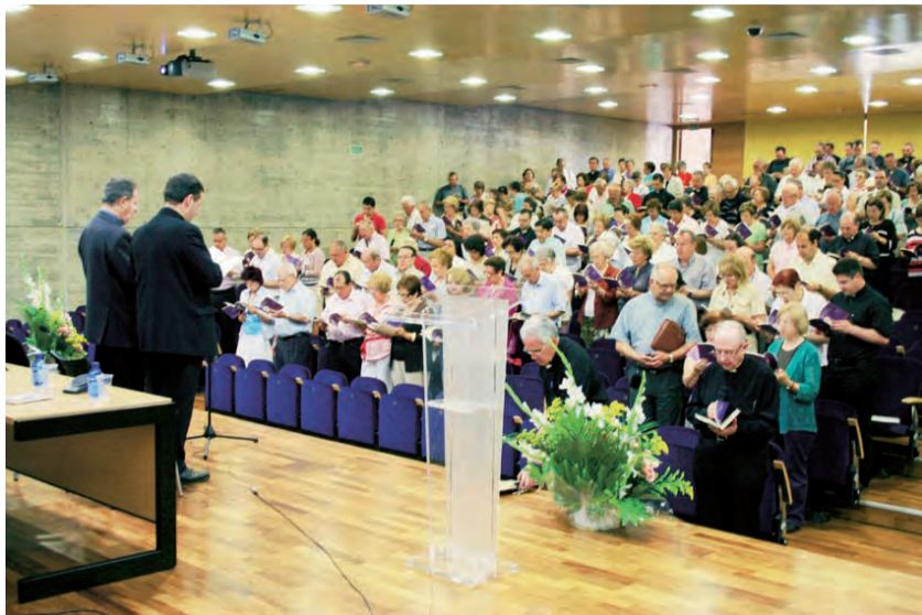
► Momento de la Oración Inicial del encuentro.

cobardía, timidez) en la acción hacia afuera de la parroquia.