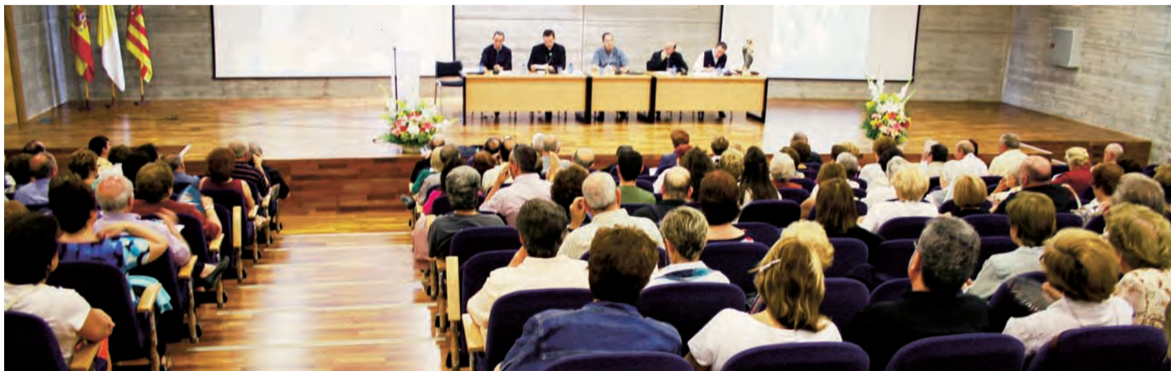
► Vista general del Salón de Actos del Obispado durante el Encuentro.