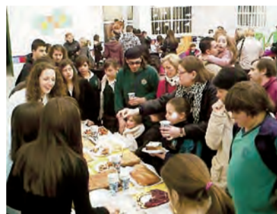
► Almuerzo solidario.

«Que cada uno dé de si lo mejor que pueda dar»