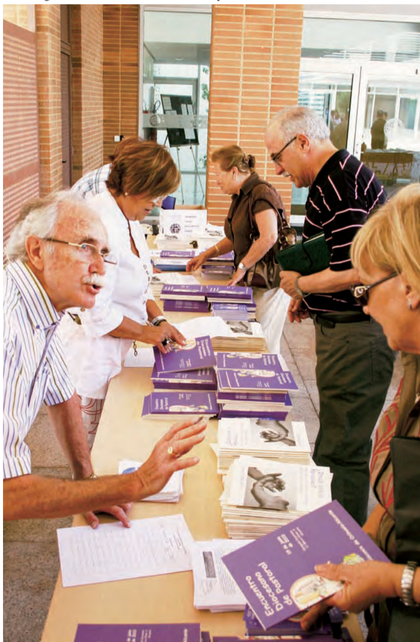
► Los asistentes recogen el material del Encuentro Diocesano de Pastoral.

Con el salón de actos del obispado abarrotado de cristianos procedentes de todas las parroquias y movimientos de la Diócesis se celebró el pasado 19 de junio el Encuentro Diocesano de Pastoral. La prioridad pastoral de la diócesis para el cuatrienio 2007-2011 es revitalizar la parroquia para que crezca como comunidad evangelizada y evangelizadora.