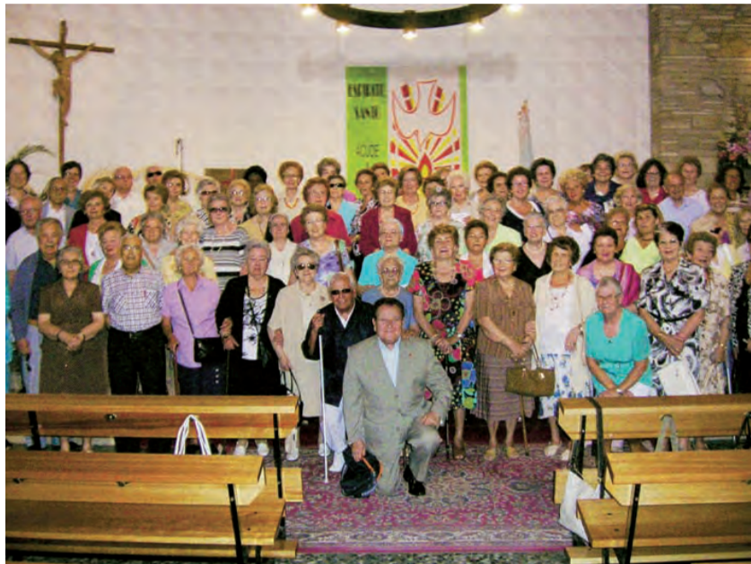
► Grupo de la Asamblea General de Vida Ascendente en El Campello.