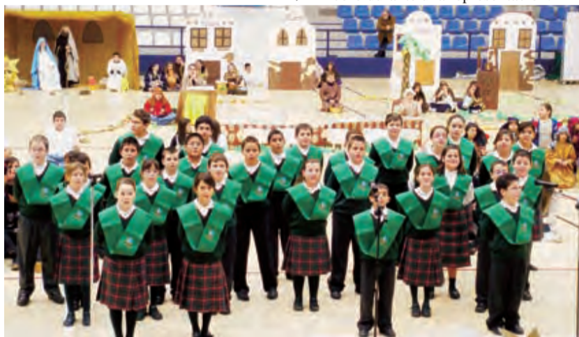
► El coro durante una representación.