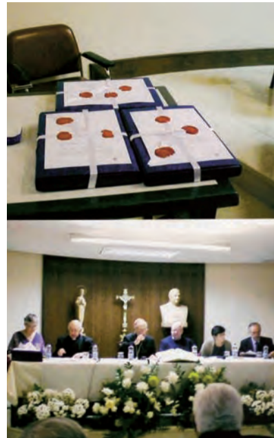
► Arriba: los documentos sellados. ► Debajo: mesa presidida por el Cardenal Rouco Varela.

Para más información: Causa de canonización, Bto. Manuel González C/Tutor, 15-17, 28008 Madrid.