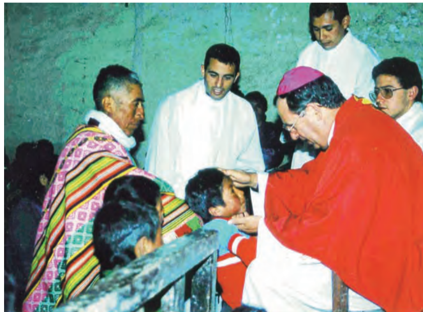
► D. Rafael durante una confirmación en Perú.

Nuestra tarea como cristianos es acercarnos a los hermanos, salir a las plazas y calles de la ciudad e invitar a todos al banquete festivo