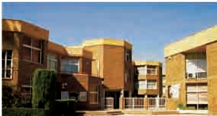
► Exterior del colegio Santa María del Carmen.

Un colegio católico crece en Alicante. En este momento en que toda la comunidad educativa católica fortalece y renueva su propuesta educativa, el Colegio de las Carmelitas de Alicante amplía su proyecto educativo incorporando el Bachillerato con las modalidades de Ciencias y Tecnología, y Humanidades y Ciencias Sociales. Las Hermanas de la Virgen María del Monte Carmelo llevan más de cien años en Alicante educando. Su Colegio se sitúa en unas magníficas y modernas instalaciones cerca de la universidad, entre los barrios de Rabasa y San Agustín. Allí desarrollan su tarea educativa con un amplio grupo de docentes y en íntima cola-