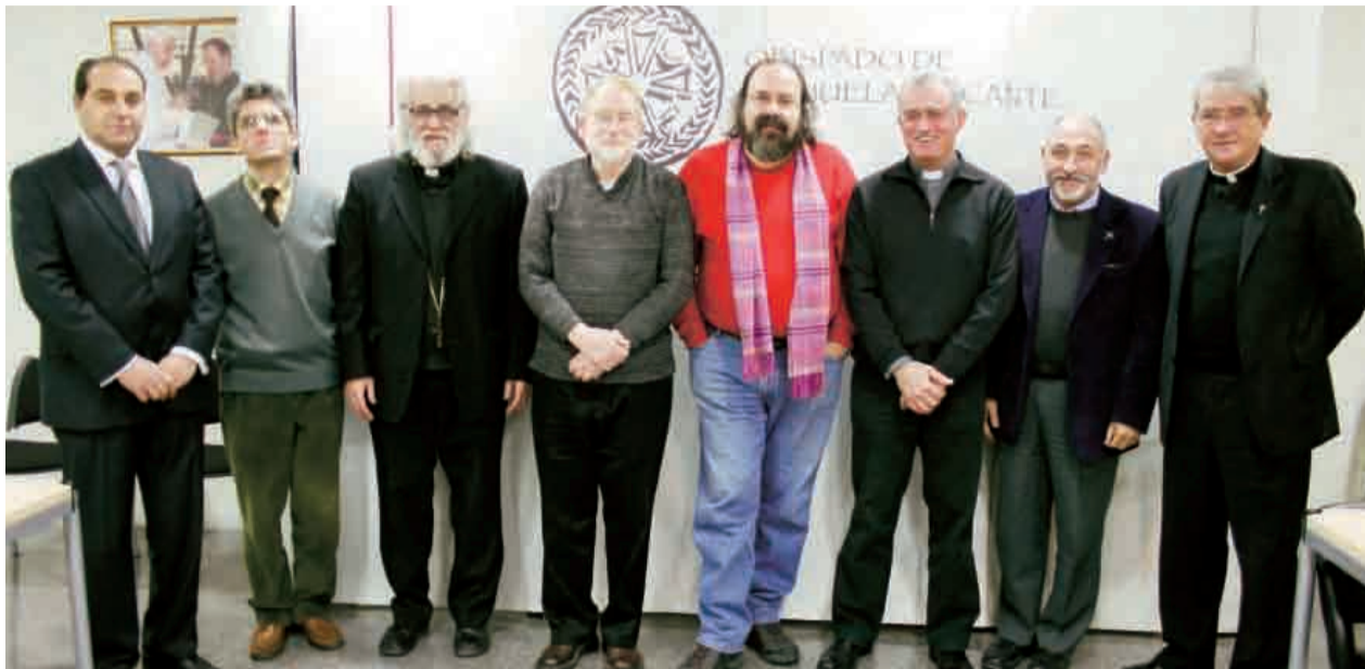
► En el Obispado, representantes de las diferentes comunidades cristianas que conviven en la provincia de Alicante.

Lugar: Parroquia de San Pascual (Capuchinos) C/ Reyes Católicos, 36, ALICANTE