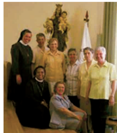
► Las 8 hermanas que están en el colegio.

27) de elegir el tipo de centro educativo que tienen para sus padres. La propuesta cristiana pretende el desarrollo pleno de la personalidad del alumno: la construcción de personas cristianas abiertas a Dios y para el servicio responsable de la sociedad: lograr en el alumno la síntesis fe-cultura y fe-vida es el alma del proyecto cristiano. Precisos son buenos docentes en continua renovación para desarrollar su tarea, capacitados no sólo intelectual y pedagógicamente, sino además siendo transmisores de fe y cultura con su propia vida. Felicitamos a las ocho hermanas que están hoy en el Colegio y a toda la familia Carmelita de Alicante.