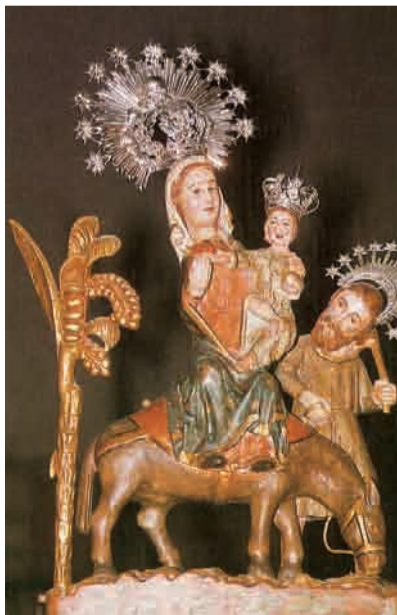
► Nuestra Señora de Revilla. Bartanás (Palencia)

Obra Social CAM 902 100 112 www.obrasocial.cam.es