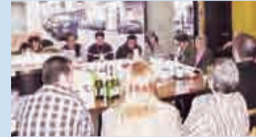
► Reunión del grupo.