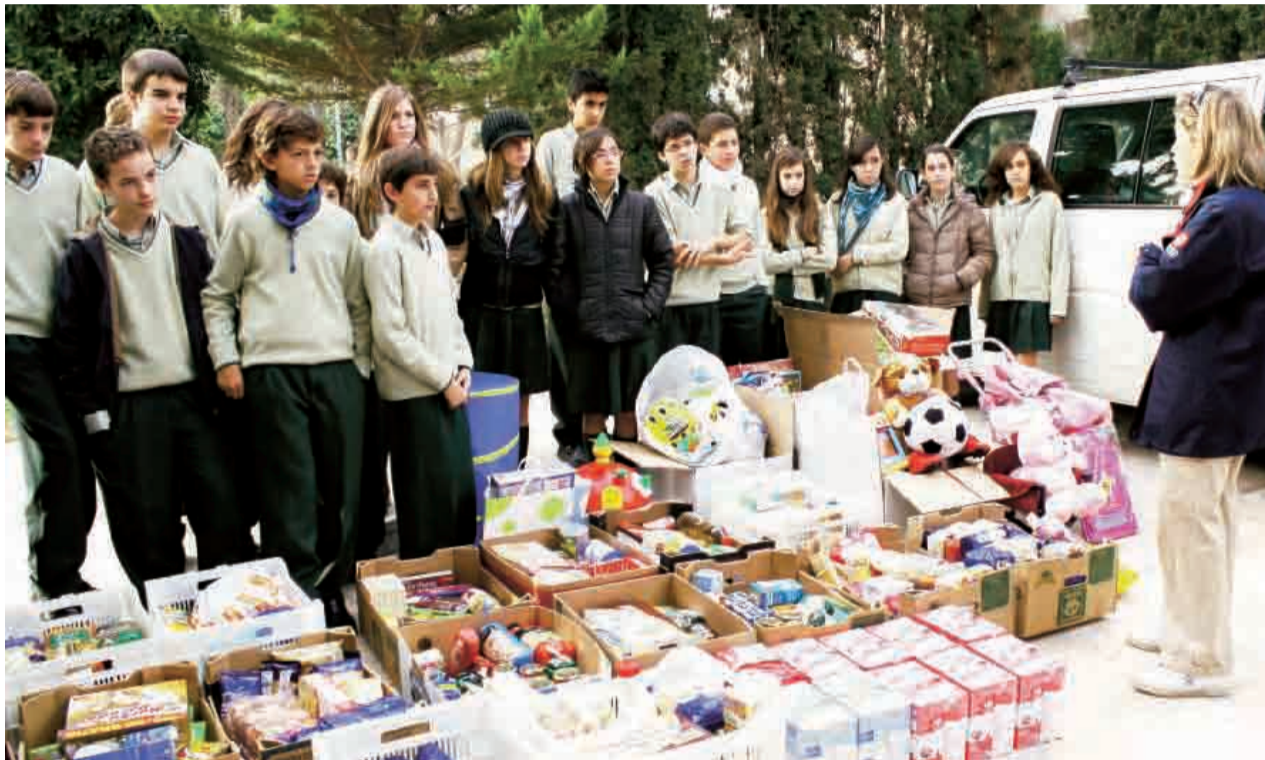
► Grupo de jóvenes colaboradores recopilando y organizando materiales y alimentos.

La iniciativa ha sido puesta en marcha por un grupo de madres del Colegio Ángel de la Guarda en estrecha colaboración con Cáritas Parroquial y otras obras sociales. El próximo 15 de diciembre se hará una recogida especial para que ningún niño, de un extenso listado, se quede sin su juguete de Navidad