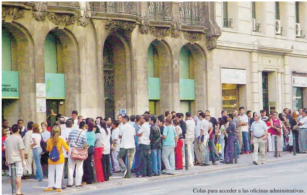
Colas para acceder a las oficinas administrativas.

El Secretariado de Migraciones de la Diócesis de Orihuela-Alicante, Asti-Alicante, publicó el pasado mes de diciembre, en el marco del Día Mundial del Inmigrante, que se celebrará el próximo 17 de enero, el informe «Inmigrantes en situación irregular. Alicante-Comunidad Valenciana-España. Análisis de la situación documental de los extranjeros en el año 2009» , cofinanciado por el Ministerio de Trabajo e Inmigración y el Fondo Social Europeo. En él se estudian dos situaciones diferentes: por una parte la irregularidad documental de los extranjeros no comunitarios y por otra la presencia de nacionales de países a los que les es de aplicación el régimen comunitario, que carecen del certificado de registro obligatorio para residir en España. Entre las principales conclusiones que se desprenden del estudio llama la atención que todavía existe un escaso grado de integración de los residentes comunitarios en la provincia. Las cifras estiman que