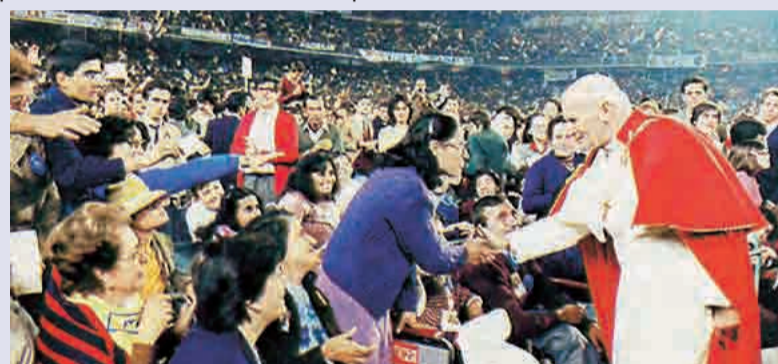
► Juan Pablo II en un encuentro con jóvenes españoles en el Santiago Bernabéu

experimentará la auténtica felicidad. Qué diferencia entre este programa de vida laicista y aquel que Juan Pablo II proponía a la juventud española en el Estadio Santiago Bernabeu aquella tarde del 3 de noviembre de 1982. Yo estaba allí, y éramos miles, y todos vibramos con la fuerza de sus palabras. El Papa nos elevó hasta las alturas con sus exigencias, sabiendo que los jóvenes han nacido para lo grande y lo noble, y no para chapotear en los vómi-