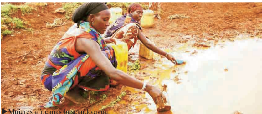
► Mujeres africanas buscando agua.

Esta conferencia mundial sobre el clima se propone preparar futuros objetivos para reemplazar los del Protocolo de Kioto, que termina en 2012. El objetivo de la conferencia, según los organizadores es «la conclusión de un acuerdo jurídicamente vinculante sobre el clima, válido en todo el mundo, que se aplica a partir de 2012». En la cumbre han estado reunidos los mejores expertos en medio ambiente, los ministros o jefes de estado y organizaciones no gubernamentales de los 192 países miembros de la CMNUCC. Esta ha sido la última conferencia para preparar el período post-Kioto. Es la primera vez que los Estados Unidos participan, siendo estos los únicos que no han firmado la ratificación del Tratado de Kioto.