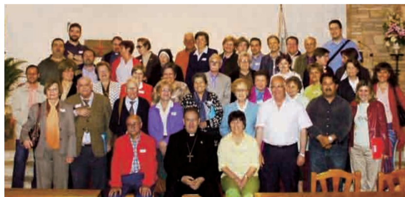
► Representantes de las asociaciones con nuestro Obispo.

evangelización. Unos grupos lo hacen a través de la oración como la Adoración Nocturna, el Apostolado de la Oración, Talleres de Oración y Vida, o la recientemente llegada a