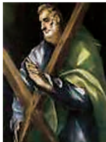
Col·lectiu de Cristians Valencians de la Diòcesi d'Oriola-Alacant

Grècia, Turquia, Bulgària, Romania, Ucraïna i sud de Rússia. També se l'ha considerat el fundador de la comunitat cristiana de Bizanci, i de fet té una gran importància en les Esglésies orientals, on sovint la litúrgia l'anomena «el primer cridat». Sant Andreu va morir crucificat a la ciutat grega de Patres. Una tradició força estesa entre nosaltres afirma que l'apòstol va morir en una creu en forma d'aspa, creu que s'ha convertit en les representacions artístiques en un element distintiu de sant Andreu.