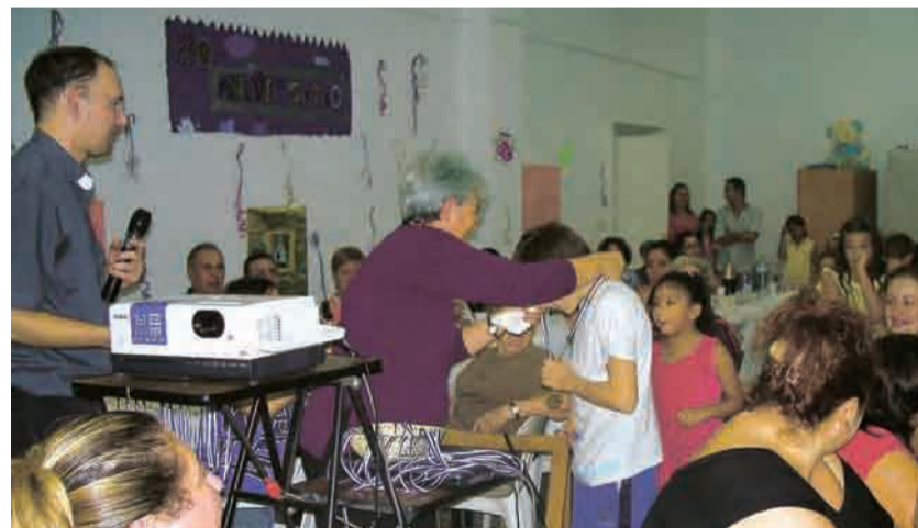
► Momento de la entrega de medallas de las actividades

En estos días pusimos en marcha juegos, deportes, organizando partidos de fútbol para los niños, los jóvenes y los adultos. El domingo por la noche cenamos con lo que cada uno traía desde su casa. Fue un acontecimiento bonito, todos juntos compartiendo lo que tiene cada uno. Acudieron todos, familias, niños, jóvenes. Los jóve-