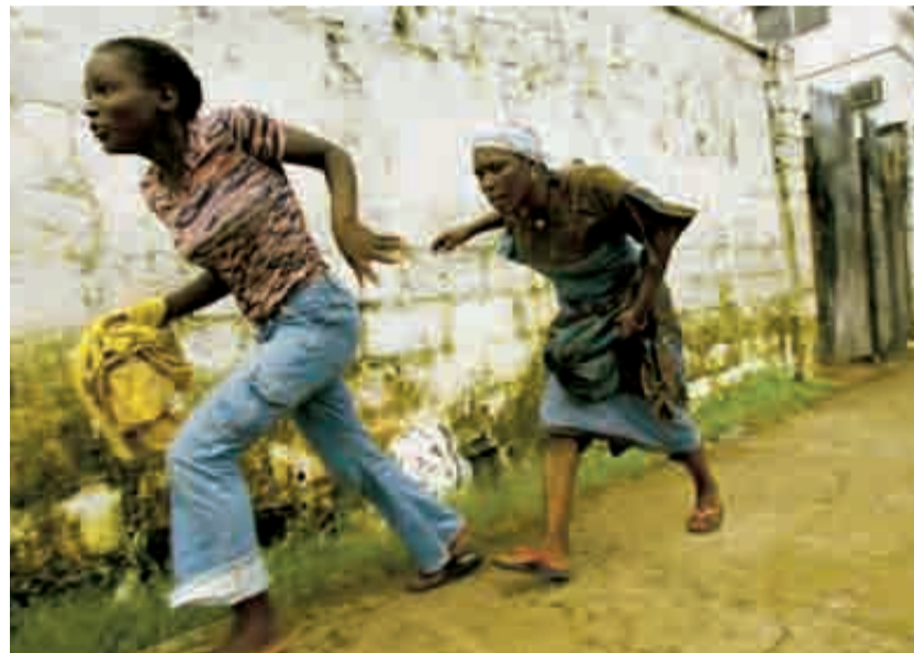
► Arriba dos mujeres corren a refugiarse, abajo a la izquierda un niño se protege con una mascarilla y evita ver los cadáveres, a la derecha tres rebeldes.

Necesitamos los buenos samaritanos de la Biblia. Queremos buenos samaritanos: nuestros hermanos, nuestros amigos en la comunidad internacional pueden venir en nuestra ayuda. Pero aún más que esto, pedimos oraciones, ¡muchas! Por nosotros, para que podamos ser fuertes y proseguir en este camino tan difícil. Pero con el Señor, lo sabemos bien, ¡al final venceremos!