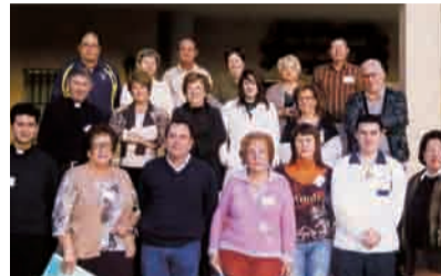
► Un grupo perteneciente al movimiento el trabajo del Encuentro de Responsables de Murcia.

La Escuela de Responsables se clausuró el 11 de Junio, habiéndose alternado en la misma, quincenalmente, charlas de sacerdotes y seglares, sobre San Pablo y la pastoral diocesana, con