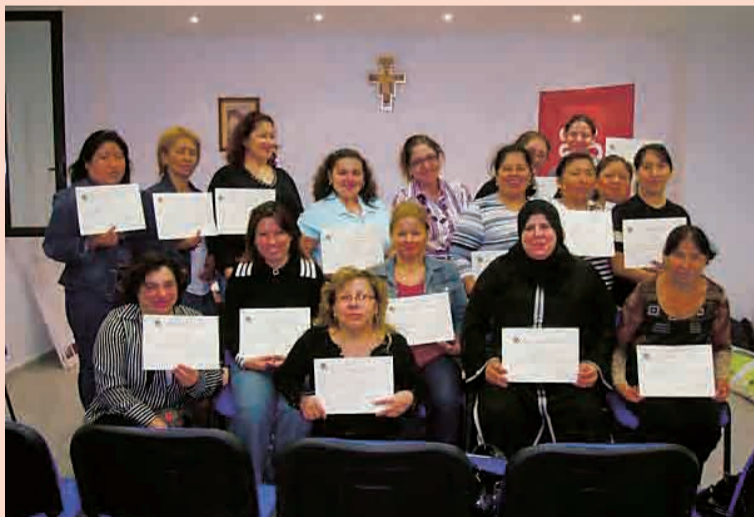
► Las asistentes al taller con su diploma.

«Desde Cáritas somos conscientes de la importancia que tiene este curso-taller para la promoción socio-pastoral para erradicar la pobreza y la exclusión social»