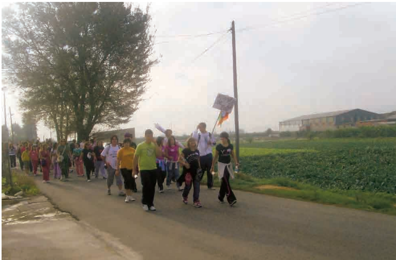
► Los jóvenes continúan la marcha alegres.

A este encuentro no le faltó de nada, pues muchas instancias públicas como los Ayuntamientos de Rafal y Orihuela, y mucha gente de aquellos municipios, se volcaron en cuidar que todo estuviera a punto: instalaciones, servicios, infraestructuras, efectivos de seguridad y escolta para el camino, pañoletas, desayuno, almuerzo, música y muchos deseos de creer que los Jóvenes también son el HOY de esta Iglesia