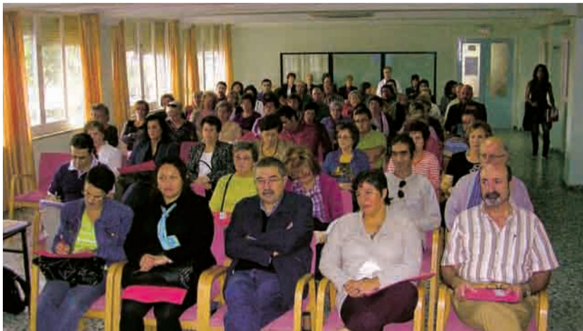
► Asistentes a la 10ª Escuela Diocesana de Formación de Cáritas

Este año, bajo el lema «Un nuevo sitio a disponer...», decidimos juntarnos en torno a la mesa de la migración, para compartir iniciativas y experiencias que nos acercan más al inmigrante, fomentando, también, actitudes positivas hacia la persona inmigrante, de manera que nuestro trabajo esté libre de prejuicios. La participación ha sido muy buena, con un total de 90 personas, en los distintos momentos de la Escuela: ponencia y seminarios. Comenzamos con la presentación del programa diocesano de Migración y la ponencia central de la Escuela,