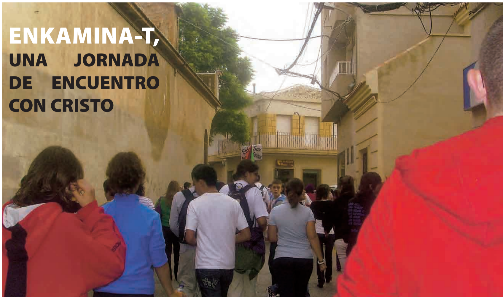
► Parte del grupo de jóvenes en marcha.

E NKAMINA-T es el lema que se ha presentado como eslogan del próximo Año Xacobeo Santiago 2009 en el que participaremos miles y miles de jóvenes europeos, tras recorrer las sendas del Apóstol Santiago; y también ha sido el lema que encabezaba el Encuentro Diocesano de Jóvenes que se celebró en Rafal y Callosa de Segura el pasado fin de semana del 30 y 31 de Octubre.