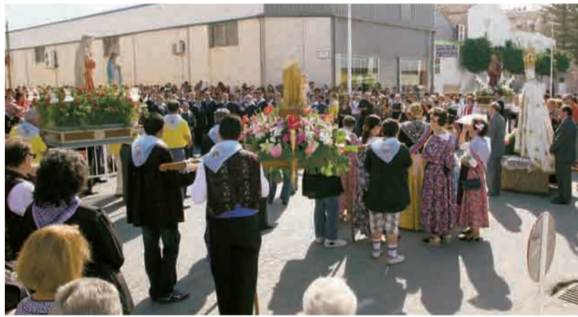
► Momento del encuentro de las Imágenes.

Nacional con el anuncio a los cuatro vientos que la Madre sale de su casa y camina al feliz encuentro con Santa Bárbara, patrona de las partidas rurales Jubalcoy y Saladas, con Santa Ana, protectora de la partida rural que lleva su nombre, con san