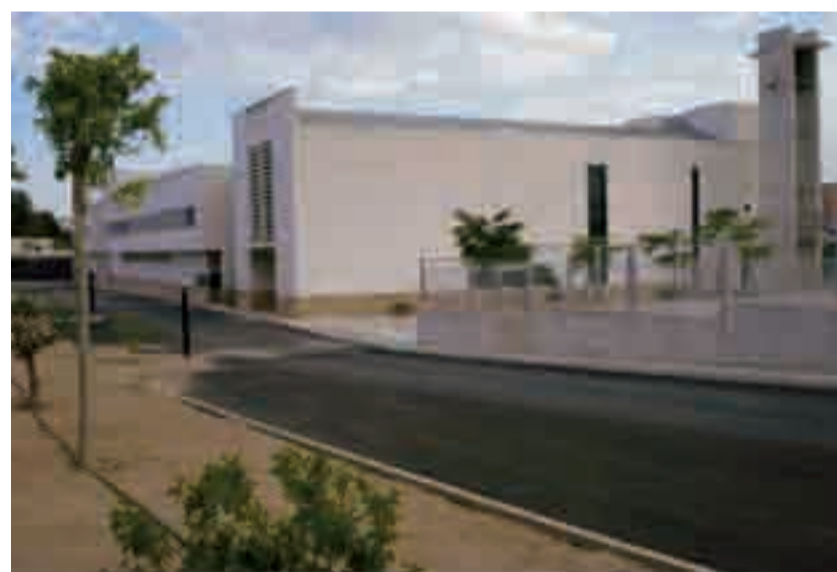
Monasterio de las Hermanas en Elche

Como en todas las instituciones religiosas: Llegar a nuestro Monasterio para conocerlos. Pero sobre todo, tener el coraje de que-