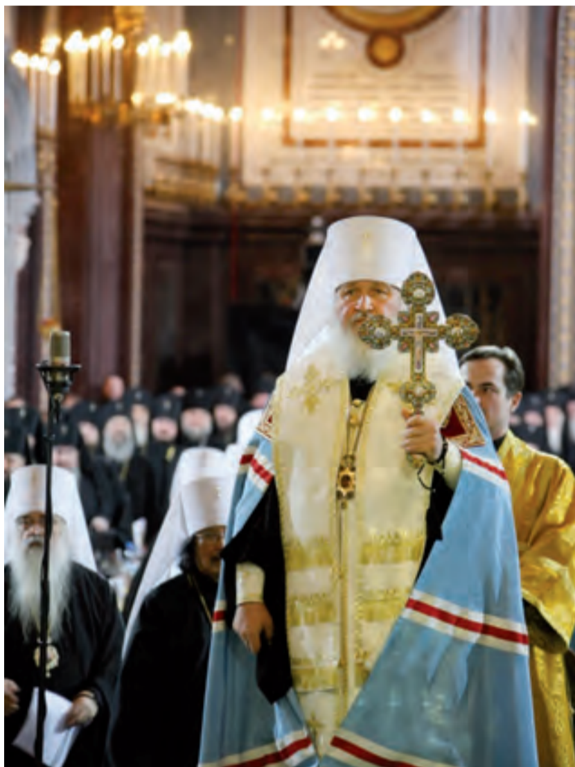
► Kirill, Patriarca de la Iglesia Ortodoxa Rusa.