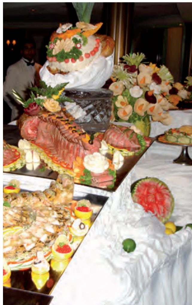
► Una cosa es hacer fiesta gozosa, y otra es el excesivo lujo y complicación de la fiesta, que desvía y distrae de lo más importante y central del acontecimiento que se celebra.