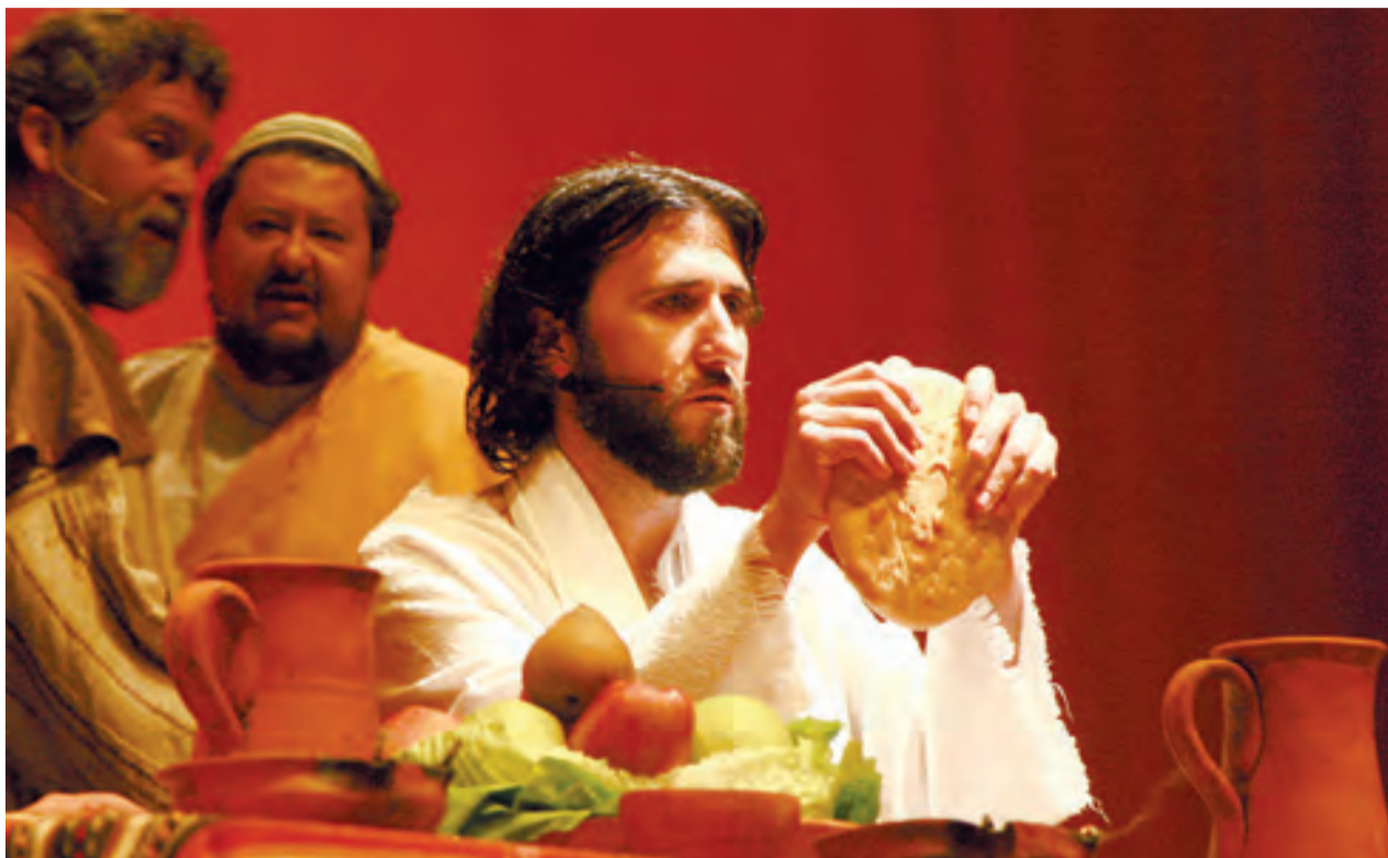
►La Última Cena: fracción del pan.

Porque si algo denotan los miembros del Grupo Jerusalem —niños, mujeres, adolescentes, ancianos— es su fe, motivadora e ilusionante, que trasladan a todos los que les acompañan en sus representaciones durante toda la Cuaresma y la Semana Santa. Y lo sé porque cuantos estuvimos viviendo, sintiendo, emocionándonos con «La Pasión» el Viernes Santo en Elche sentimos la fuerza de cada uno de sus personajes —Jesucristo, María, Pilato, Judas—, el poder del guión —textos puramente bíblicos—, y el gran calado de los diferentes pasajes —la última cena, la oración en el Monte de los Olivos, los juicios, la crucifixión, pentecostés y, cómo no, la brillante y resplandeciente resurrección—. Y todo ello acompañado por unos enriquecedores, envolventes y bien cuidados efectos especiales y multimedia. Los continuos cambios de luz, escenario, músicas y sonidos contribuyen sin duda a que el espectador se vaya me-