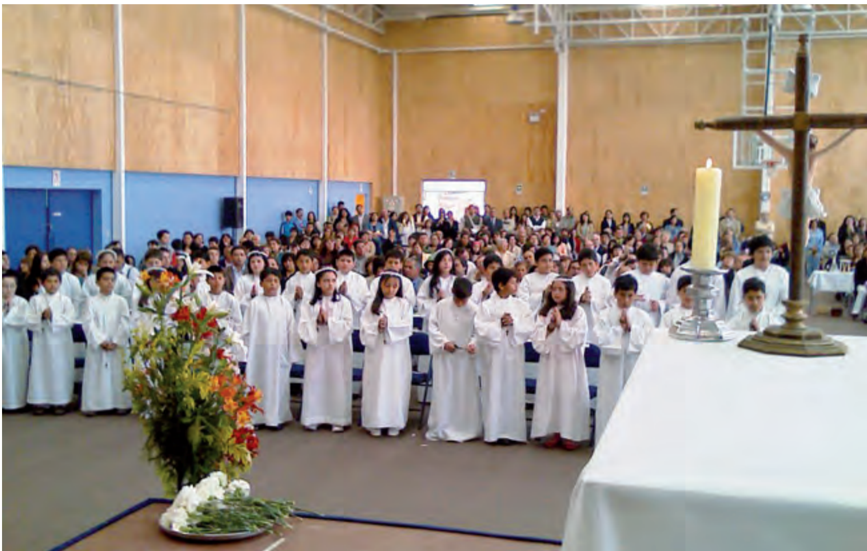
► La Primera Comunión es fundamentalmente una vivencia religiosa.