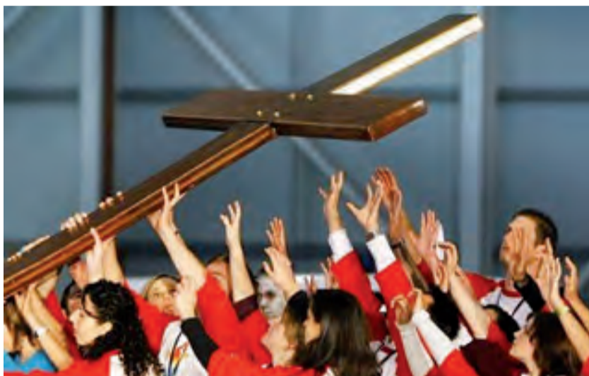
► Los jóvenes recogen la cruz, que recorrerá diversas ciudades hasta el año 2011.

Os animo, por tanto, a descubrir en la Cruz la medida infinita del amor de Cristo, y poder decir así, como san Pablo: «Vivo en la fe del Hijo de Dios, que me amó hasta entregarse por mí» (Ga 2,20). Sí, queridos jóvenes, Cristo se ha entregado por cada uno de vosotros y os ama de modo único y personal. Responded vosotros al amor de Cristo ofreciéndole vuestra vida con amor. De este modo, la preparación de la Jornada Mundial de la Juventud, cuyos trabajos habéis comenzado con mucha ilusión y entrega, serán recompensados con el fruto que pretenden estas Jornadas: renovar y fortalecer la experiencia