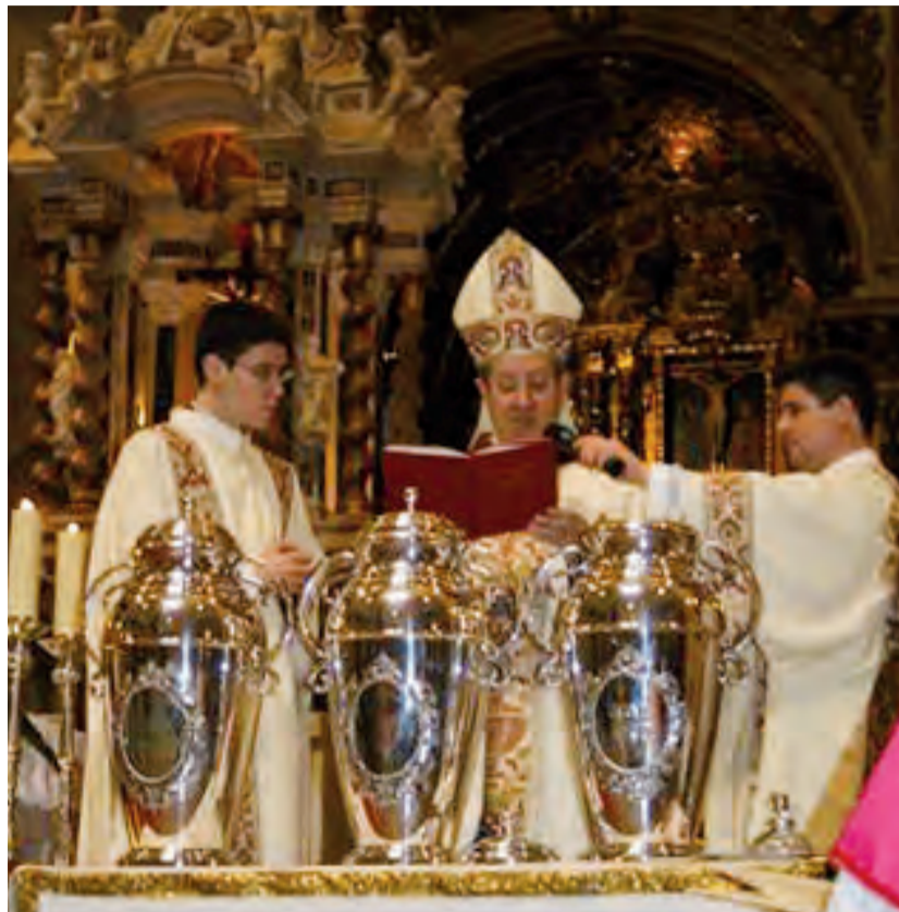
► Bendición del crisma y de los óleos de los catecúmenos y de los enfermos..

La palabra crisma proviene de latín: chrisma , que significa unción. Así se llama al aceite y bálsamo mezclados que el Obispo consagra para ungir a los nuevos bautizados y signar a los confirmados. Con él también son ungidos los Obispos y los sacerdotes en el día de su ordenación sacramental.