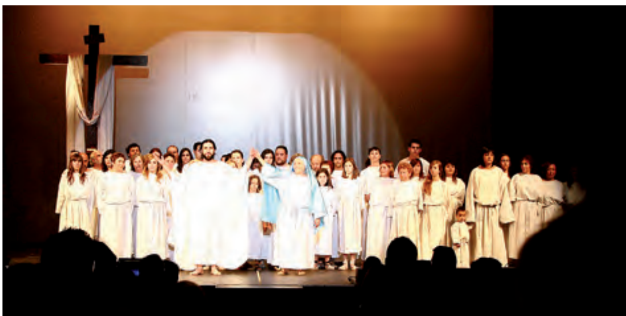
►Luz, mucha luz. Y el corazón engrandecido...