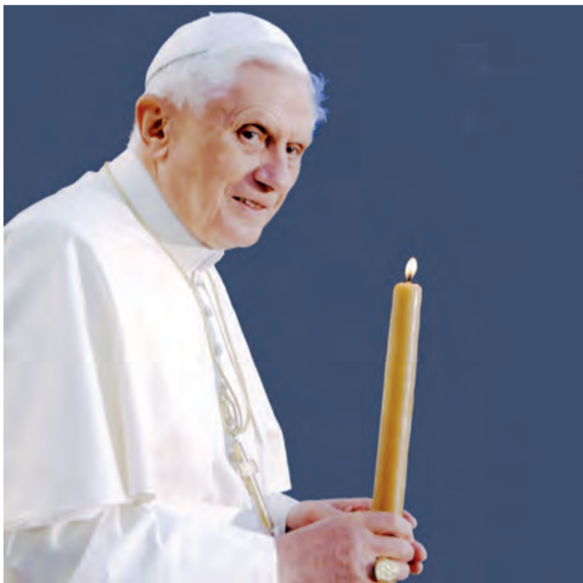
► Cristo ha resucitado para darnos la esperanza.