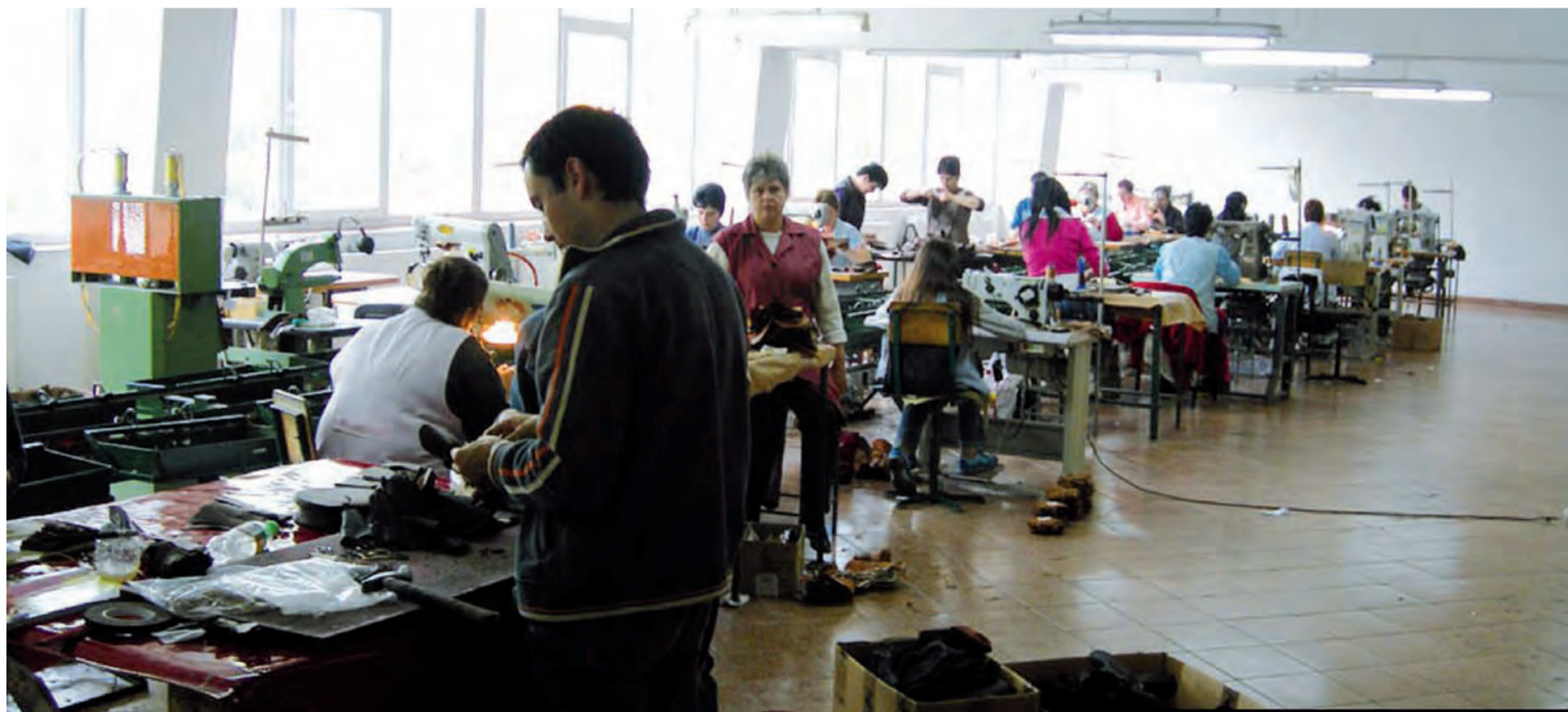
► Tenemos muchos motivos para participar, reivindicar y celebrar este 1.º de Mayo, Día Internacional de la Clase Obrera.

MUJERES TRABAJADORAS CRISTIANAS (MTC) HERMANDAD OBRERA DE ACCIÓN CATÓLICA (HOAC) JUVENTUD OBRERA CRISTIANA (JOC)